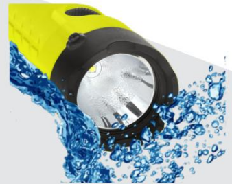
耐用的聚合物主體具有抗 衝擊性和耐化學性