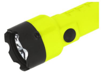
大而有質感的按鈕